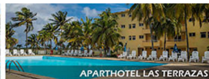
APARTHOTEL LAS TERRAZAS