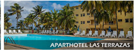
APARTHOTEL LAS TERRAZAS