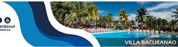
VILLA BACURANA O